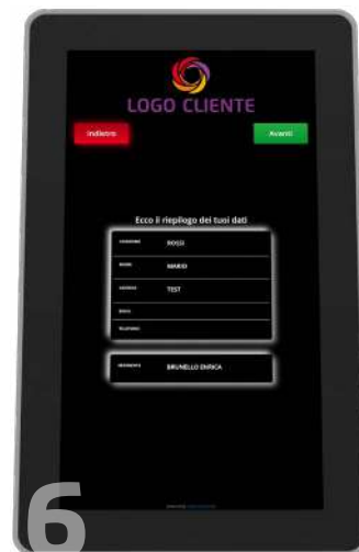
6 Riepilogo e conferma dati inseriti