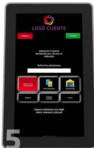
5 Scelta referente interno da lista precompilata, con ricerca nominale o per gruppo di riferimento