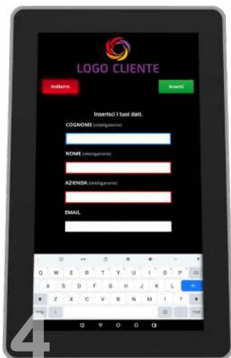
4 Inserimento dati con pratica tastiera touch