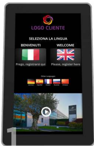
1 Schermata di accoglienza con possibilità di inserire un video aziendale sempre disponibile