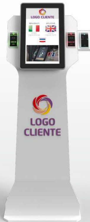
COLORE BIANCO LUCIDO