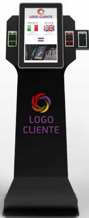
COLORE NERO LUCIDO