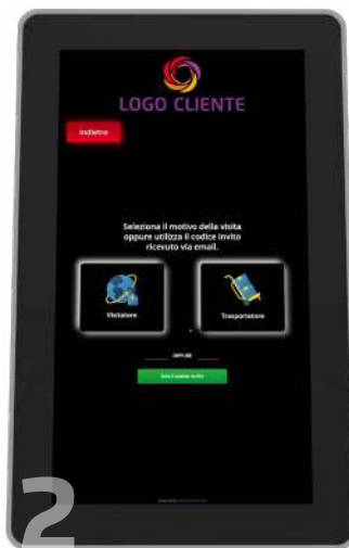
2 Possibilità di estendere la registrazione agli autotrasportatori o altre categorie (esterni...)