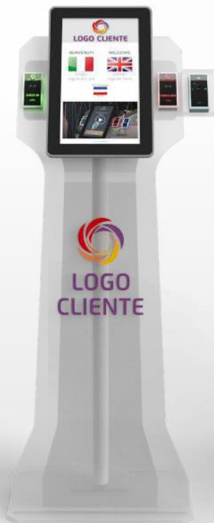
COLORE TRASPARENTE CON PELLICOLA OPALINA