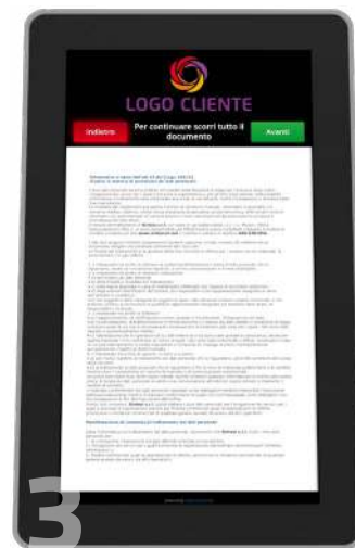
3 Visualizzazione e approvazione norme di sicurezza, privacy e altro deciso dall'azienda