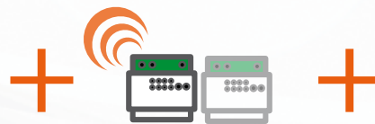
COORDINATORE RIHA 23