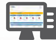
SOFTWARE DI GESTIONE